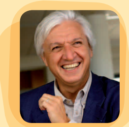
Dominique Clément Maire de Saint-Benoît