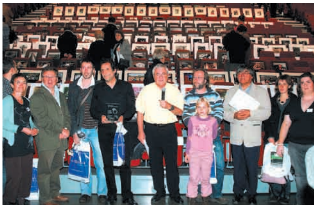
Remise des prix 2009

Si cette manifestation est une réussite, elle le doit également à la qualité des œuvres d'exposants prestigieux qui étaient malheureusement absents. On pense à Danielle et Olivier Föllmi, auteurs d'une exposition intitulée "Sagesse en Orient", qui se sont attachés aux causes des plus démunis. Et que