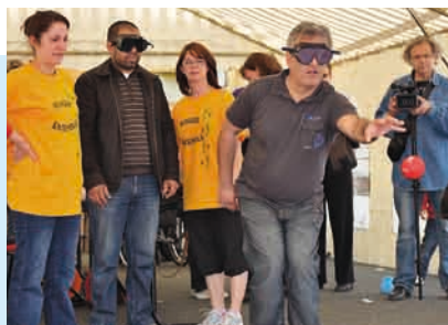
Concours de cécipétanque

Il convient de rendre hommage au personnel des services techniques municipaux qui a fait preuve d'une grande réactivité pour le tronçonnage des branches, le dégagement des arbres tombés sur les voies, le dégagement des lignes électriques et pour l'aide et les conseils prodigués en cette circonstance aux habitants. Un personnel définitivement très sollicité ces derniers mois, avec 24 jours de neige et plusieurs épisodes de verglas.