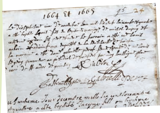
Les registres anciens ont fait l'objet de travaux de restauration.