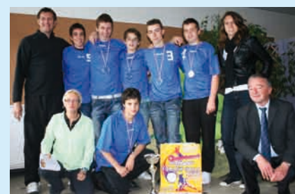
Équipe minime volley-ball du collège Théophraste Renaudot