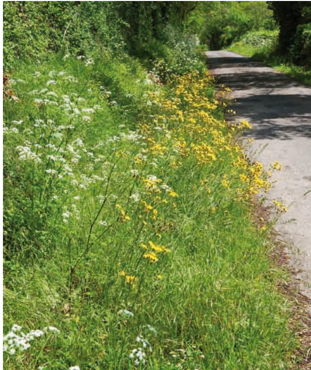
Accotements fleuris, riches en insectes et en variétés végétales

L'effort de la commune vise donc à limiter tout type de désherbage. Une grande partie des zones de l'espace public pourrait ainsi être enherbée (sols stabilisés, allées, aires de jeux...), avec tonte 3 à 4 fois seulement par an.