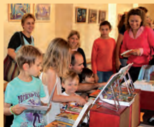
1 er salon du livre jeunesse.

Les auteurs présents ont signé toute la journée et étaient ravis de revoir les enseignants et les enfants devenus plus grands... ●