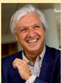
Dominique Clément Maire de Saint-Benoît