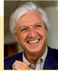
Dominique Clément Maire de Saint-Benoît, vice-président de Grand Poitiers