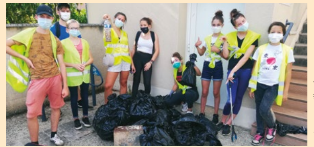
Journée "Saint-Benoît Clean-up day"

Pas d'ouverture de l'accueil Jeunes les mercredis durant le confinement !